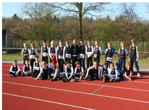
Jeugdgroep AVS 2010