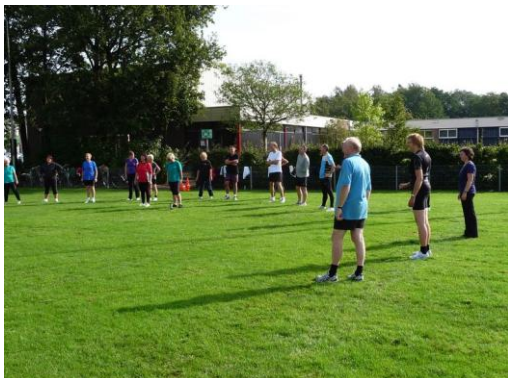
Clinic starters 2010